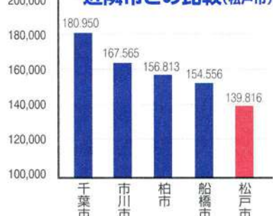
1人あたりの市税収入の 近隣市との比較(松戸市)